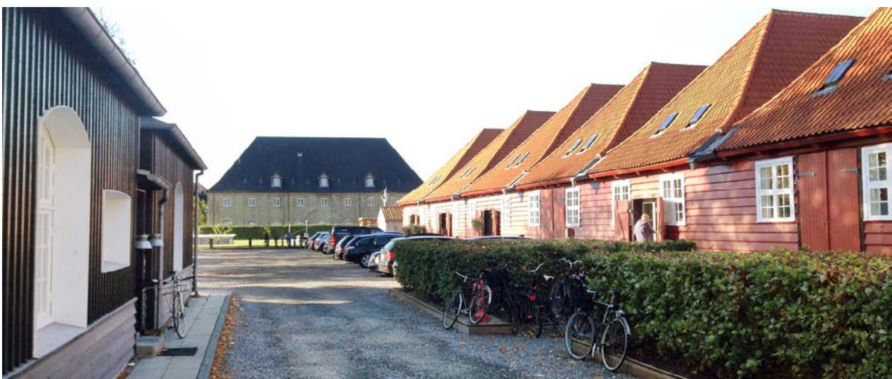
Billede fra Galionsvej med mastescurene til højre i billedet og Kuglegårdens nordlige fløj i baggrunden

Overgangen fra Christianshavn til Holmen er tydelig og fortæller om hver sin meget forskellige tankegang om bybygning. På den ene side forsvarsbyen med dens indbyggede logik og på den anden side Handelsbyens med dens logik. Overgangen er markeret med de to vagthuse ved Værftsbroen, hvorefter Arsenaløen træder frem. Holme og kanaler og åbne kig, lav bebyggelse og grønne strukturer er dominerende træk. Bebyggelsesplanen følger gademønsteret, og kan virke ret enkel, men er mere kompleks med en sammensætning af markante store murede bygninger som sammen med lave og farverige træbygninger og træer skaber et mere rummeligt spændende byområde.