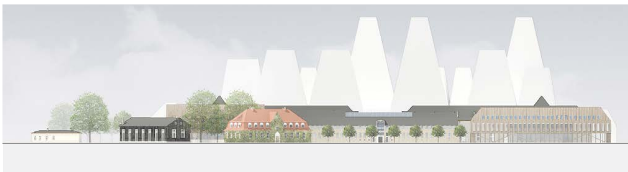
Opstalt langs Danneskiold-Samsøes Allé, der viser sammenhænge mellem eksisterende og ny bebyggelse. I baggrunden ses omridset af ny bebyggelse på Christiansholm