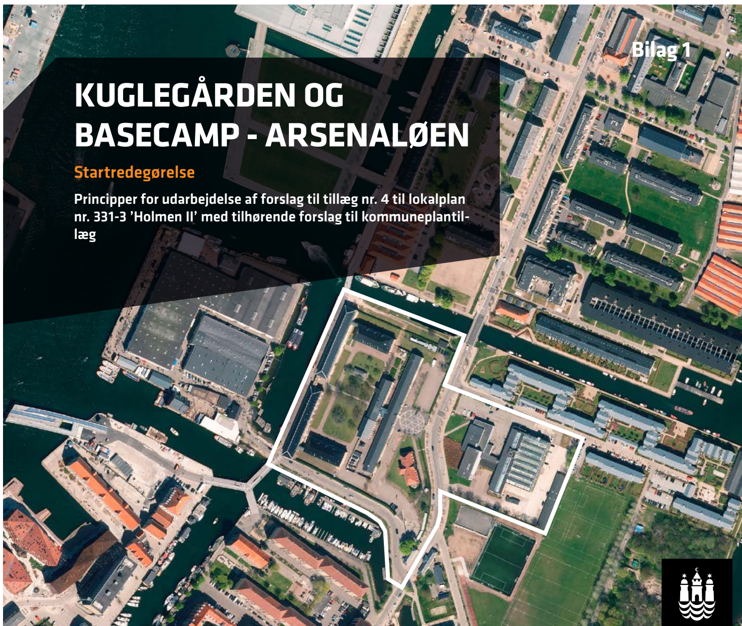
Luftfoto over området

Principper for udarbejdelse af forslag til tillæg nr. 4 til lokalplan nr. 331-3 'Holmen II' med tilhørende forslag til kommuneplantillæg