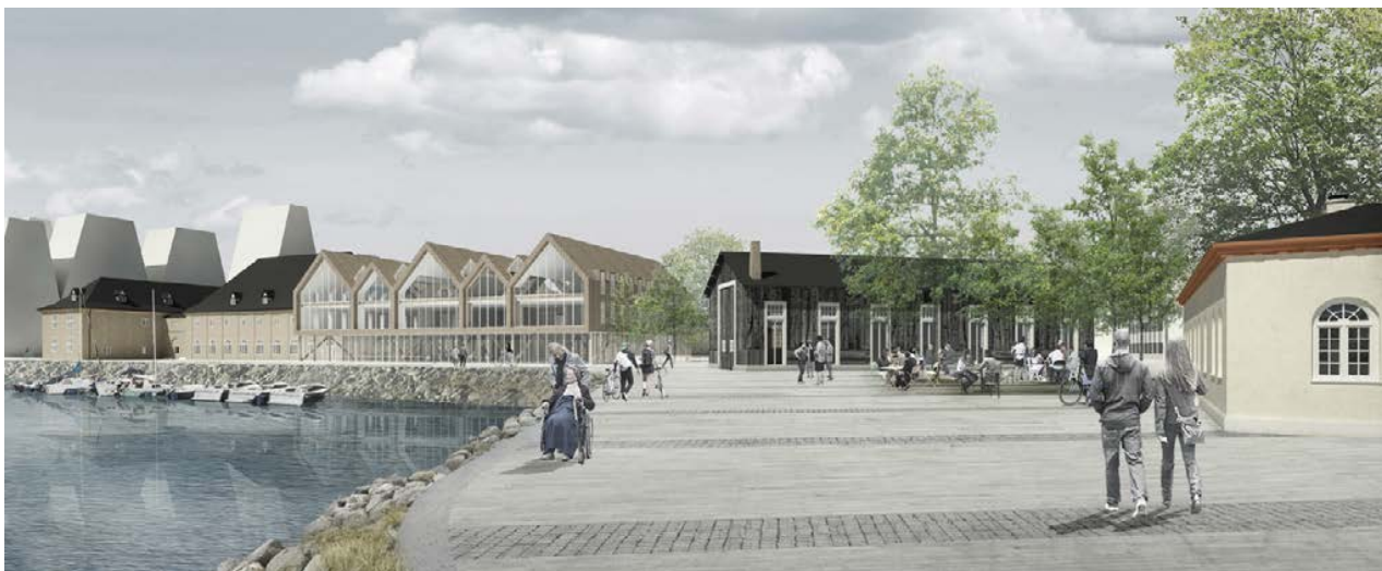
Visualisering, der viser en pladsdannelse for enden af Trangraven. Lystøndeskuret er omdannet til en aktiv facade, og den nye bebyggelse ved Kuglegaarden danner front mod kanalrummet