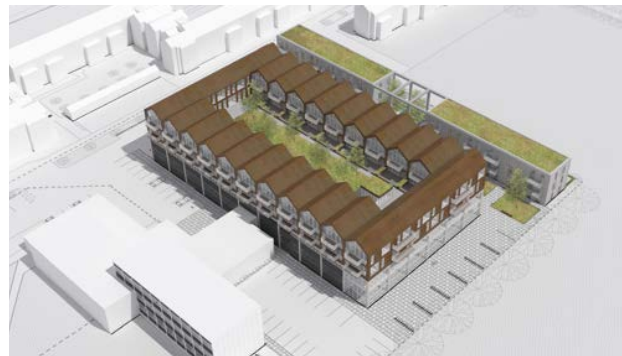
Ny bebyggelse ved Basecamp. Tilbygning på den eksisterende hal, og rækkehuse på grundens østlige side, hvor der nu er garager.

grønne bytræk. Der er ruter langs kanalerne, og de åbne grønne græsfelter bibeholdes og udvides ved Basecamp. De eksisterende beplantninger langs facader videreføres ved nybygninger, ligesom beplantningen suppleres med større træer enten byplan-traditionen tro, som enkeltstående solitære træer, i grupper eller plantet som alléer. Denne grønne del udbygges med en langt større artsrigdom og med en større biodiversitet til følge.