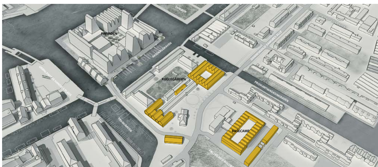
Illustration der med gult viser foreslået ny bebyggelse på Arsenaløen

København skal være en bæredygtig by med byrum, der inviterer til et mangfoldigt og unikt byliv. Kuglegården skal udvikles fra et lukket militært område til et mere udadvendt område, der indgår og spiller sammen med det øvrige Holmen. Særligt Trangravspladsen beliggende på Christianshavnsruten kan blive en attraktiv solrig plads, der med genopførelsen af 'Lystøndeskuret' skaber gode rammer for byliv. Herudover vil der, langs kanalerne være kantzoner, mindre byrum, samt stedvist åbne facader, der skaber sammenhæng mellem bebyggelsen og vandet.