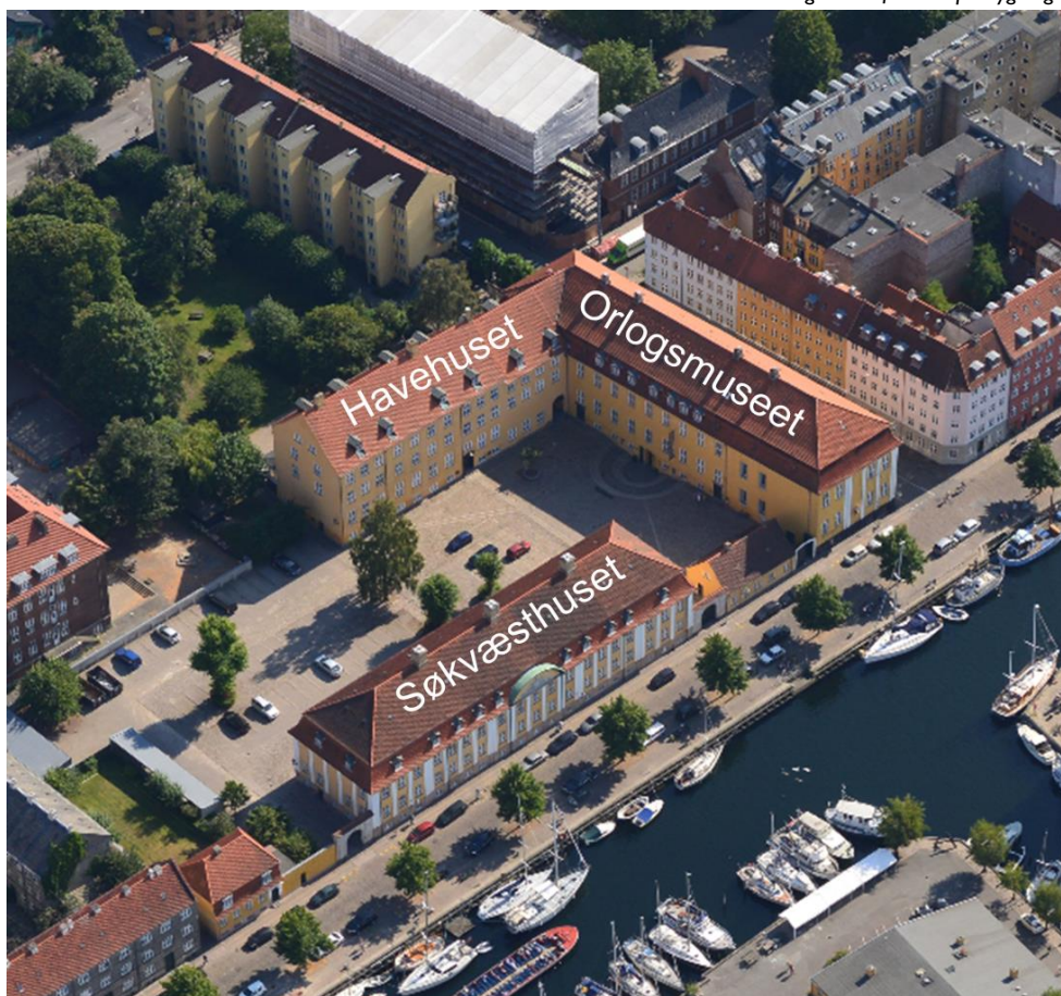
Angivelse af navne på bygninger

Forslag til kommuneplantillæg "Søkvæsthuset" er i offentlig høring i perioden 30. oktober 2017 til og med 26. november 2017.